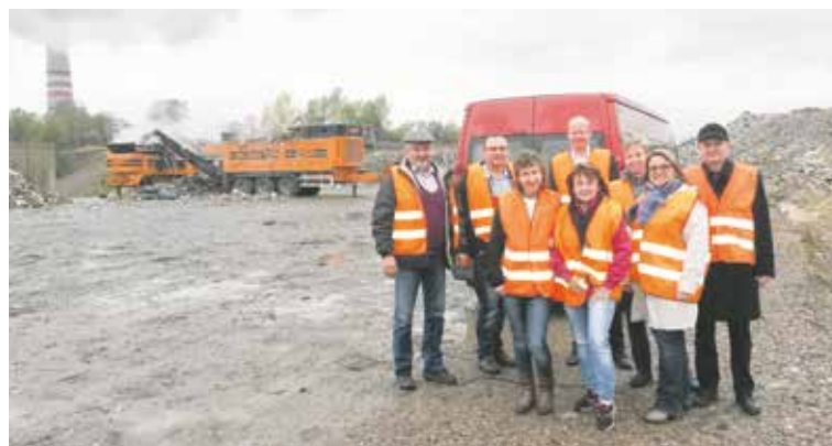
Mikroregion Chrudimsko řeší problematiku ukládání odpadů. Na snímku z exkurze ve Zdechovicích.

Podpora bude poskytována nejen v rámci zadávacích řízení dle zákona o zadávání veřejných zakázek, ale i v případě zadávání veřejných zakázek malého rozsahu, a to v rámci celého životního cyklu veřejné zakázky.